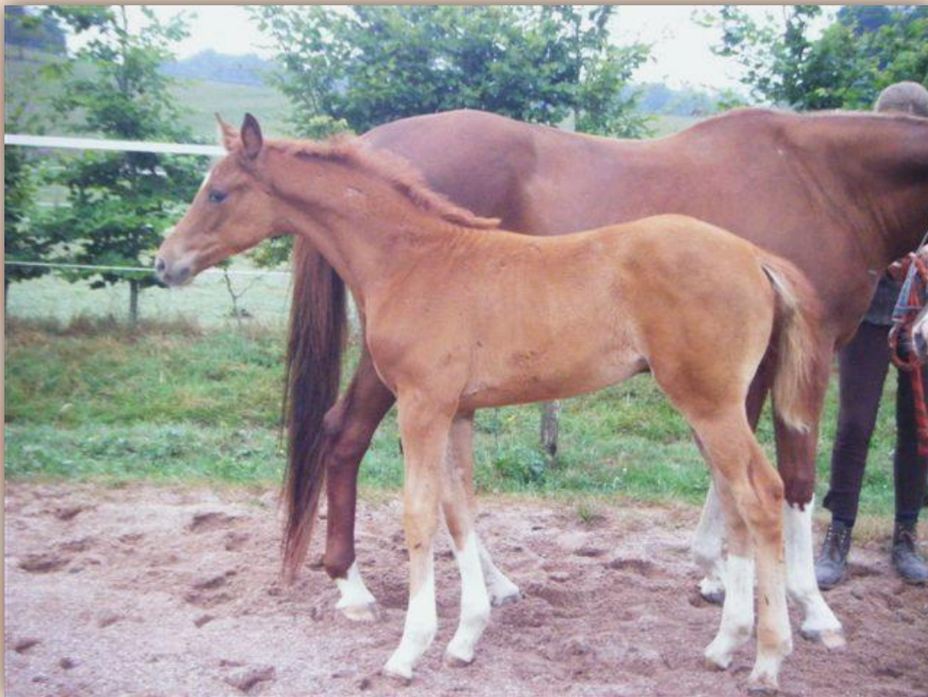
Faiga Romance Mansolein ruim 60 % volbloed

Nu is een hengst als bijv Jazz wel een soort van garantie voor genoeg "go" in een paard, maar dat is niet hetzelfde als bloed voeren.