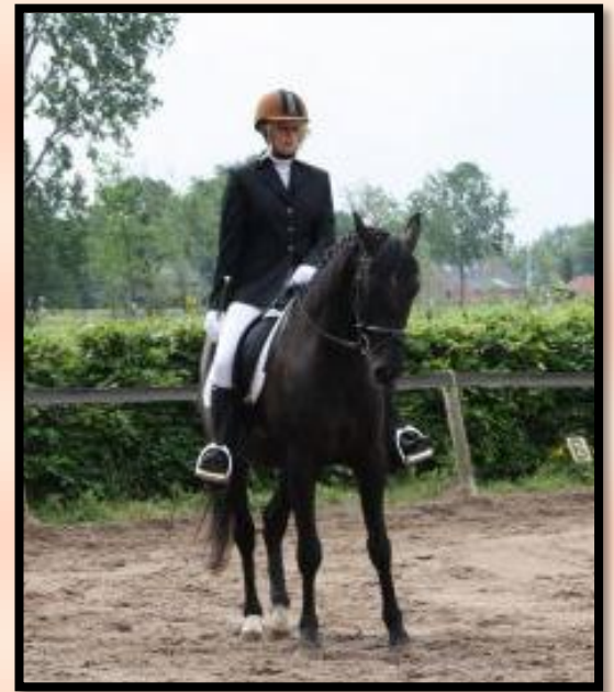
Natalie met Mansoleins Danser