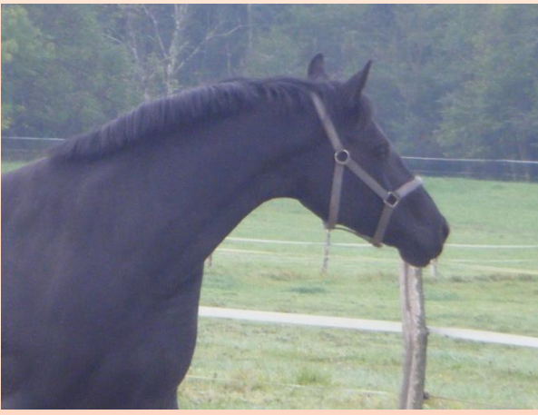
Wendela- A eerste dag buiten bij Stal Mansolein